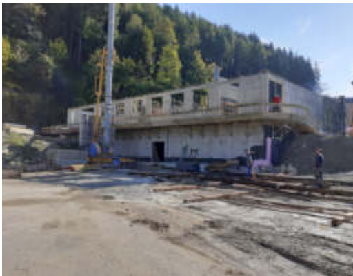
Ein Teil des Kindergartens wurde unterkellert

Der Neubau des Kindergartens schreitet zügig voran. Nachdem der Keller fertig gestellt wurde, sieht man schon die ersten Wände unseres Kindergartens. Wenn die Witterung mitspielt, ist geplant, dass mit Weihnachten der gesamte Rohbau steht. Im Herbst 2021 soll der Kindergarten in Betrieb gehen.