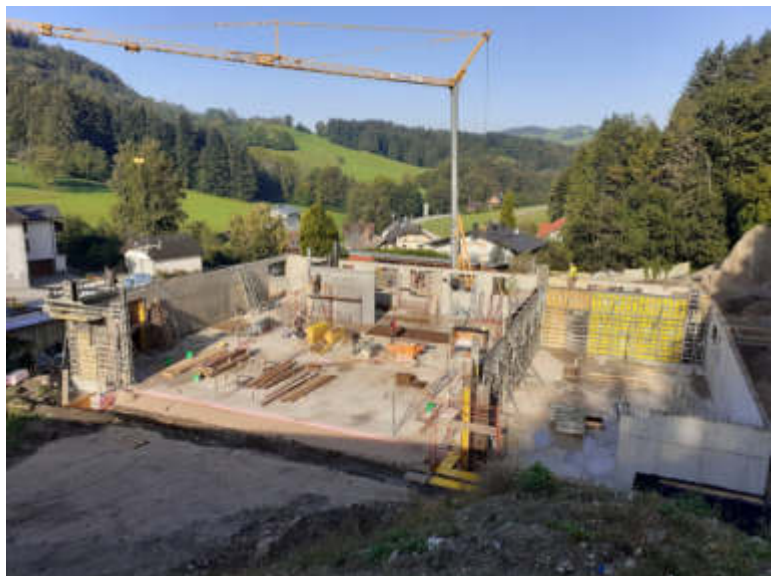
Die Außenwände des Kindergartens haben schon Gestalt angenommen.

In der letzten Gemeinderatssitzung im September wurden für den Kindergarten einige Gewerke vergeben: