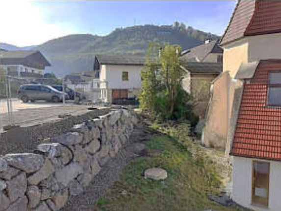
Der neue Steinwurf hinter der Kirche

Der nächste Schritt wird das Verlegen der Stufen der seitlichen Treppe vom Musium zum Stadler-Parkplatz sein. Ebenso werden heuer noch die unterirdischen Elektroinstallationen vorgenommen und die Natursteinmauern errichtet. Die Gesamtkosten aller bisherigen Vergaben betragen € 185.232,-.