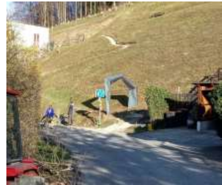
Ein Starttor und eine Sitzgelegenheit mit Schautafel bilden den Beginn

Adelheidweg wird der bereits bestehende Weg durch verschiedene Stationen erweitert. Den Endpunkt am Burgsattel bildet wieder ein Metalltor. Ein großes Dankeschön an die Dorfwerkstätte, die das Projekt in Eigenregie umsetzt.