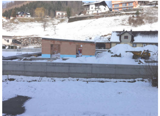
Die Baumeisterarbeiten sind abgeschlossen, als nächstes werden die Zimmerer die Baustelle übernehmen.