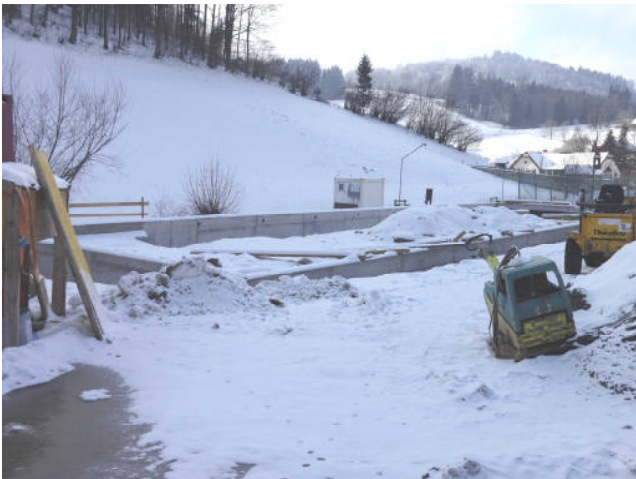
Die Fundamente der Stocksportbahn wurden betoniert.

Eine besonders große Unterstützung sind aber auch die Koordinatoren, die die Einteilung der freiwilligen Helfer übernehmen und die Baustelle betreuen. Danke!