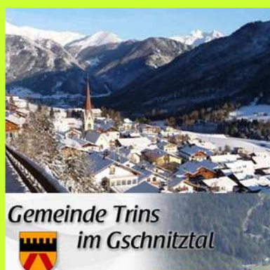
Gemeinde Trins im Gschnitztal